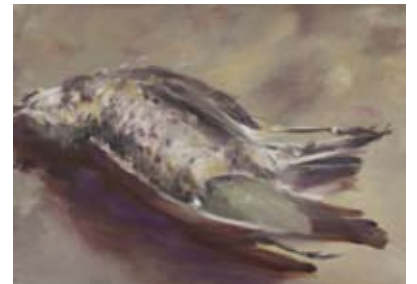
Bird 2008, Oil on cotton, 50 x 70 cm

© Galerie Andres Thalmann, Zürich, 2011 © Barbara Ellmerer © Text: Alice Henkes Translation: Margret Powell-Joss Designed by Lisa Robertson Printed in Konstanz by werk zwei Print + Medien Konstanz GmbH Edition: 1400 Exemplare ISBN: 978-3-9523863-1-6