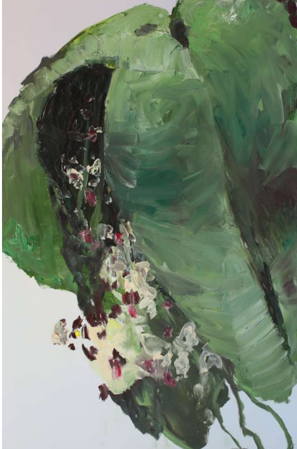
Explo 2010, Oil on cotton, 200 x 130 cm or 130 x 200 cm