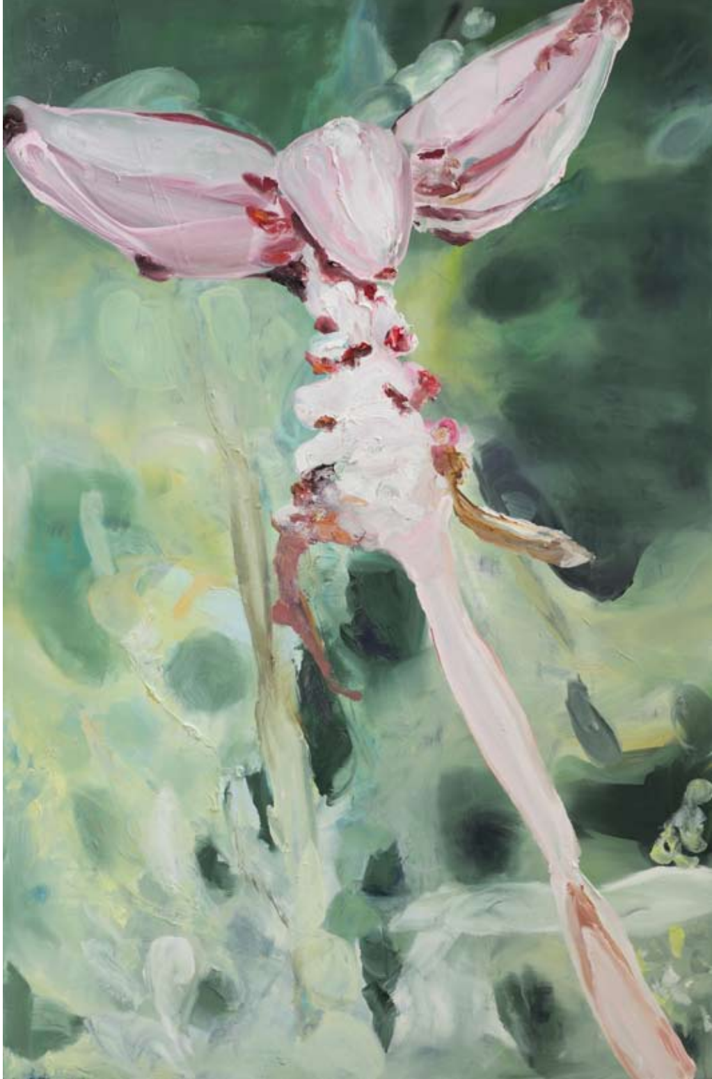
Lengua 2011, Oil on cotton, 200 x 130 cm