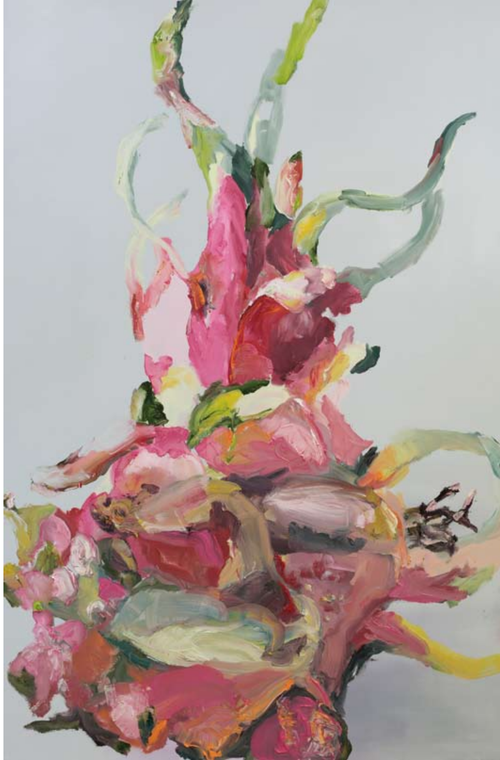
Dragona 2011, Oil on cotton, 200 x 130 cm or 130 x 200 cm