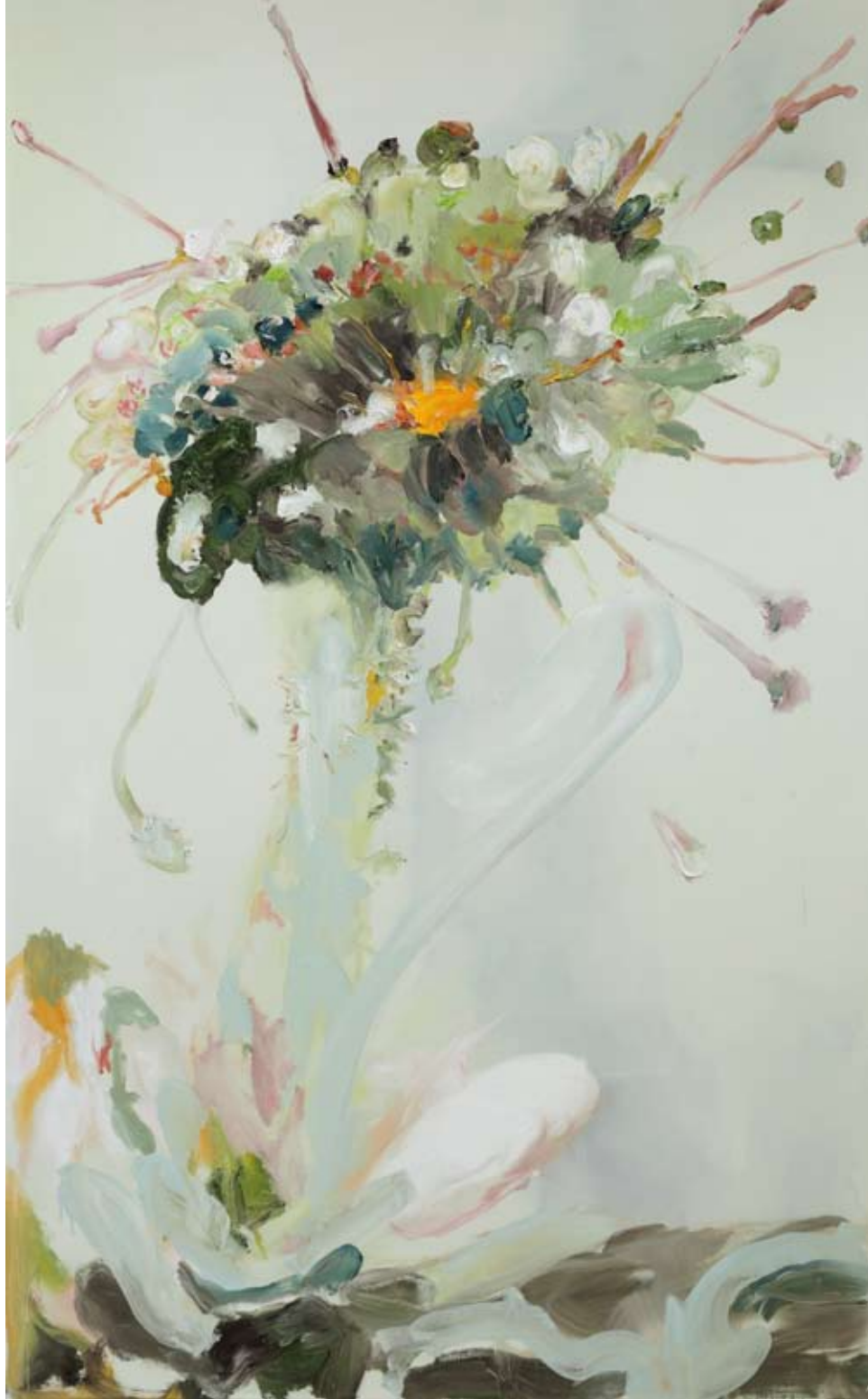
White Carnivore 2010, Oil on cotton, 200 x 120 cm